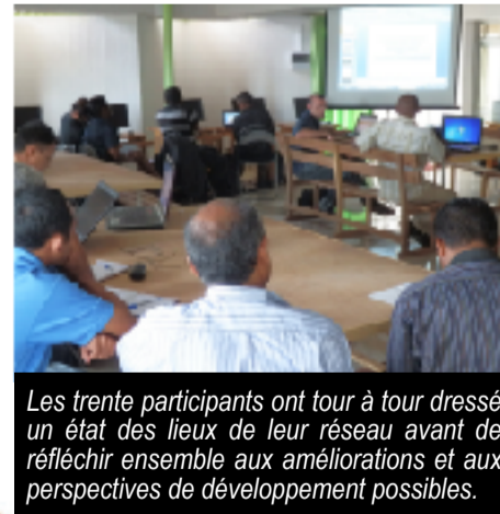
Les trente participants ont tour à tour dressé un état des lieux de leur réseau avant de réfléchir ensemble aux améliorations et aux perspectives de développement possibles.