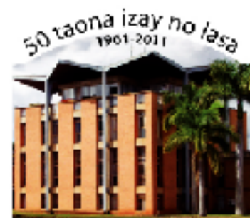
Ary hamiratra hatrany