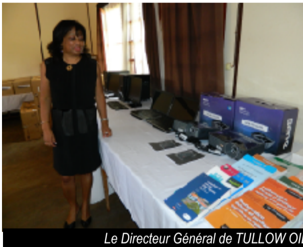
Le Directeur Général de TULLOW OIL MADAGASCAR offrant les matériels